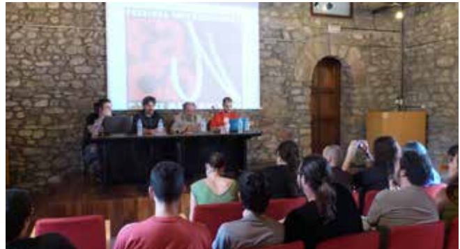
Presentació del Festival FanCon BCN

És previst que Fancon utilitzi diferents equipaments i espais del municipi com el Parc de l'Hostal del Fum, el Pavelló Municipal d'Esports Maria Víctor, l'Institut Ramon Casas i Carbó, el Teatre de la Vila i els propis carrers de la vila.