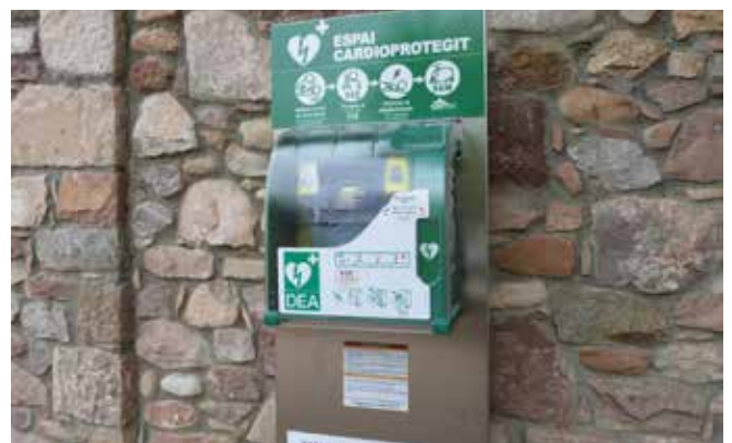
Desfibril·lador automàtic instal·lat a la Masia de Can Cortès.