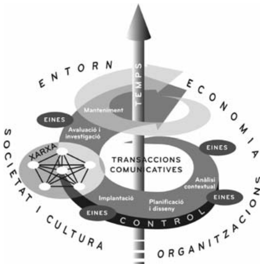
Figura 1. Esquema de la planificació participativa, en el nucli de la qual resideixen les transaccions comunicatives dels participants en un context ambiental, organitzatiu, econòmic, cultural i temporal concret. Les transaccions contenen amb el suport d'una gran varietat d'eines durant les fases solapades i iteratives de la planificació. L'autocontrol i l'avaluació col·lectius i continus són la manera de buscar la direcció i la temporalització adequades, especialment en el cas de les xarxes de participació.

donar lloc a un plantejament que té en compte el gènere i l'edat (cicle vital) en la planificació i el desenvolupament participatius. La planificació participativa pot definir-se com una «pràctica social, ètica i política en la qual les dones i els homes, els nens, els joves i les persones grans participen en diferent grau en les fases superposades del cicle de planificació i presa de decisions, ajudats per un conjunt adequat d'eines i mètodes capacitadors» (vegeu la figura 1; Horelli et al. 2000; Horelli, 2002b, 611). El mainstreaming de gènere implica en aquest context que caldria tenir en compte les visions, l'elecció d'estratègies i els mètodes de cada fase, així com tots els àmbits i sectors.