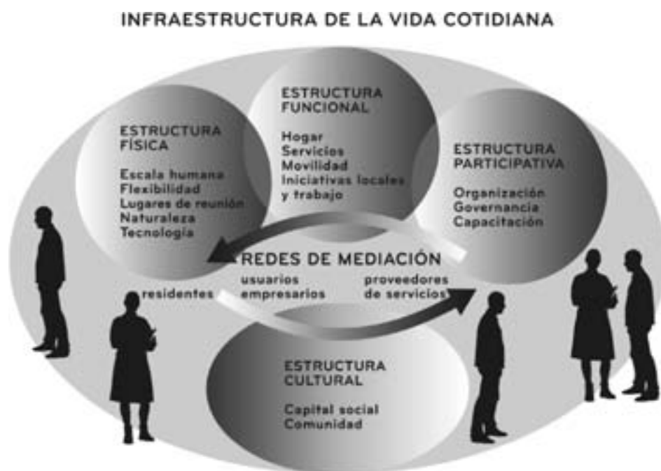
Figura 2. Una infraestructura de apoyo a la vida cotidiana para grupos que dependen de su vecindario

Aunque el «tiempo» está integrado en ambos tipos de teorías (véanse las figuras 1 y 2), no ha sido un planteamiento significativo. Así pues, es importante integrar las políticas temporales en los esfuerzos anteriores.