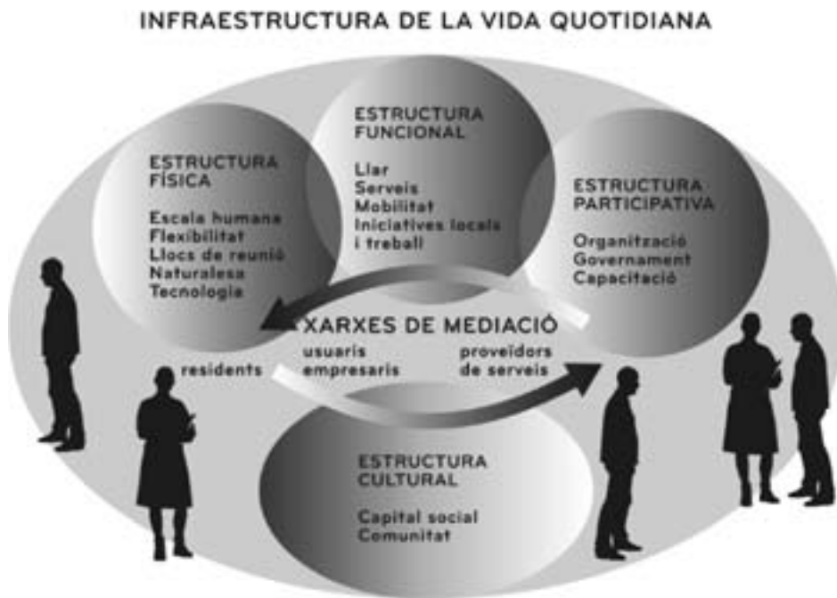
Figura 2. Una infraestructura de suport a la vida quotidiana per a grups que depenen del seu veïnat.

Tot i que el «temps» està integrat en ambdós tipus de teories (vegeu les figures 1 i 2), encara no s'ha fet un plantejament significatiu. Així, doncs, és important integrar les polítiques temporals en els esforços anteriors.