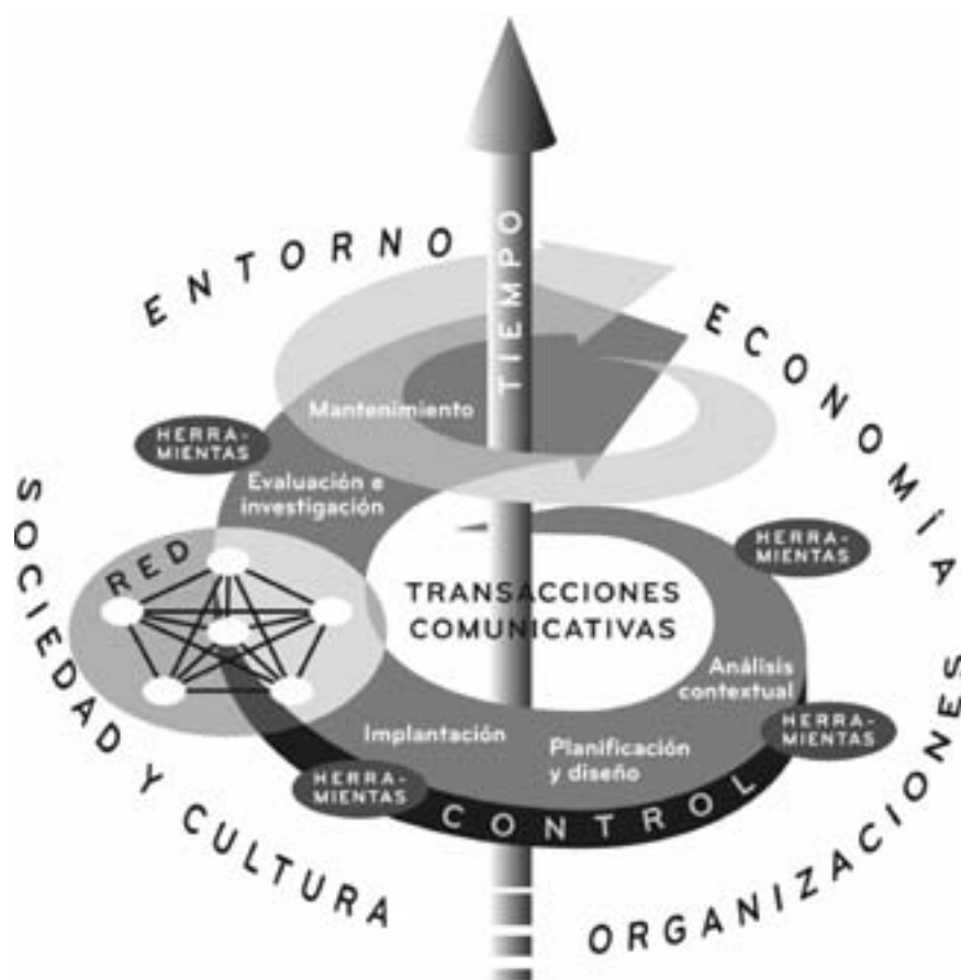
Figura 1. Esquema de la planificación participativa, en cuyo núcleo residen las transacciones comunicativas de los participantes en un contexto ambiental, organizativo, económico, cultural y temporal concreto. Las transacciones cuentan con el apoyo de una gran variedad de herramientas durante las fases solapadas e iterativas de la planificación. El autocontrol y evaluación colectivos y continuos son la forma de buscar la dirección y temporalización adecuadas, especialmente en el caso de las redes de participación.

lugar a un planteamiento que tiene en cuenta el género y la edad (ciclo vital) en la planificación y el desarrollo participativos. La planificación participativa puede definirse como una «práctica social, ética y política en la que las mujeres y los hombres, los niños, los jóvenes y las personas mayores participan en distinto grado en las fases solapadas del ciclo de planificación y toma de decisiones, ayudados por un conjunto adecuado de herramientas y métodos capacitadores» (véase la figura 1; Horelli et al. 2000; Horelli, 2002b, 611). El mainstreaming de género implica en este contexto que debería prestarse atención a las visiones, la elección de estrategias y los métodos de cada fase, así como a todos los ámbitos y sectores.