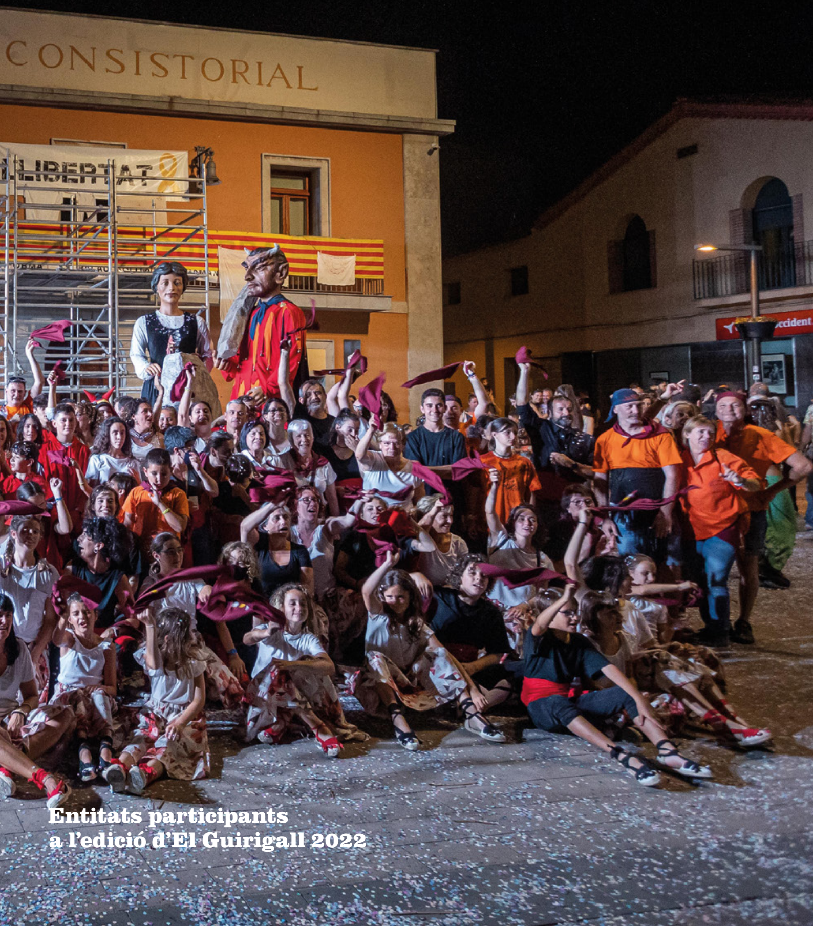
Entitats participants a l'edició d'El Guirigall 2022