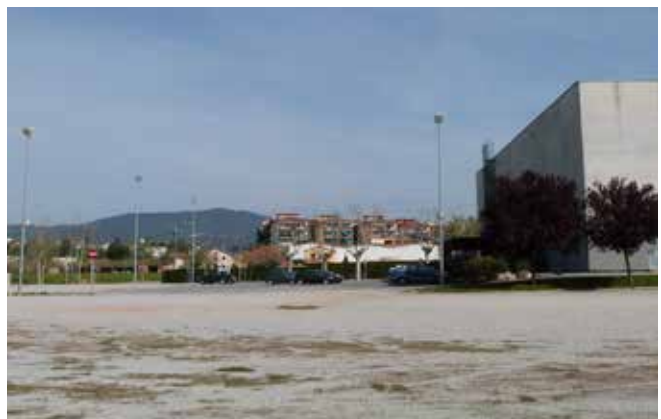
Ubicació prevista per a la nova pista polivalent coberta.

Pel que fa a la via pública i urbanització, els projectes s'ubiquen a polígons industrials, la Serra de Can Riera, Montjuïc -on també s'inclou l'execució del clavegueram per dotar d'escomesa a totes les parcel·les-, la Sagrera, Santa Magdalena, pg. de la Carrerada i av. Catalunya. També es vol millorar l'enllumenat de diversos carrers del centre. Quant a immobles, hi són diversos edificis municipals, el Castell de Plegamans, la Sala Polivalent, el Teatre de la Vila, l'Escorxador, la comissaria i el Jutjat de Pau, les masies de Can Malla, Can Falguera i Can Cortès, la Torre de la Casa Folch, el pavelló d'esports, el camp de futbol i els centres educatius.