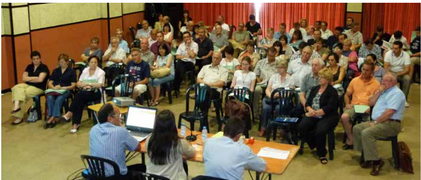
Imatges superior i inferior: Xerrades informatives sobre l'elaboració del POUM celebrades el juny del 2012

Creiem que és necessari aquest dispositiu d'informació i comunicació per tal que ningú se senti desinformat sobre el POUM i que tothom qui ho desitgi pugui fer al·legacions.