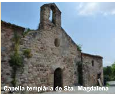
Capella templària de Sta. Magdalena