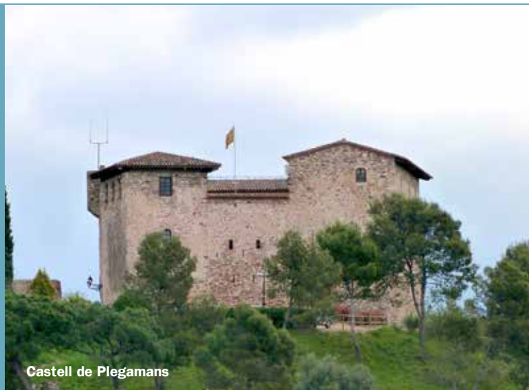
Castell de Plegamans

Un dels objectius del POUM és la catalogació dels elements paisatgístics, arquitectònics i arqueològics més importants del municipi, com a integrants del patrimoni cultural català, per tal de protegir-los, conservar-ne la seva memòria i fomentar-ne la difusió i investigació.