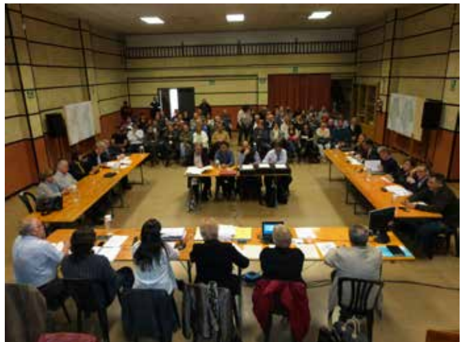
Ple extraordinari d'aprovació inicial del POUM

La previsió amb que treballa el govern municipal és que el POUM pugui entrar en vigor durant aquest mandat, que finalitza el maig de 2015.