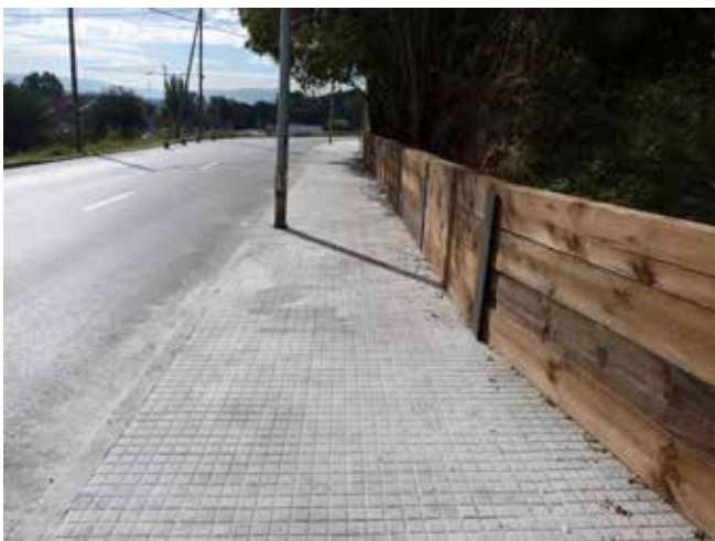
S'ha fet una nova vorera per facilitar el pas dels veïns de La Sagrera i Can Cladellas cap a l'escola