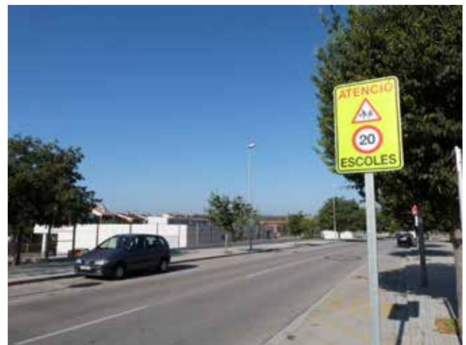
A l'entorn dels centres educatius també s'ha senyalitzat la velocitat màxima de 20 km/h