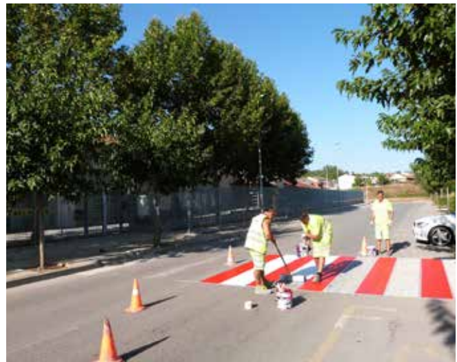
Als centres escolars, s'han pintat els passos de vianants en vermell i blanc per fer-los més visibles.