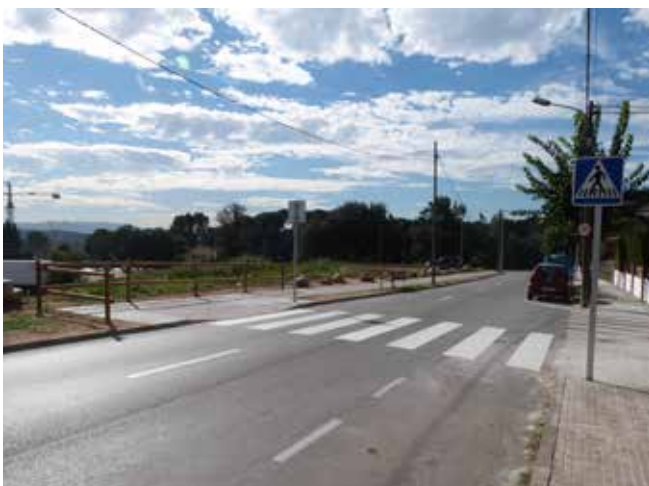
A més de la nova vorera, s'han pintat els passos de vianants i s'ha millorat l'accessibilitat de la zona