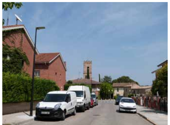
El barri de La Sagrera ha estat el pioner en la instal·lació de llums amb tecnologia LED