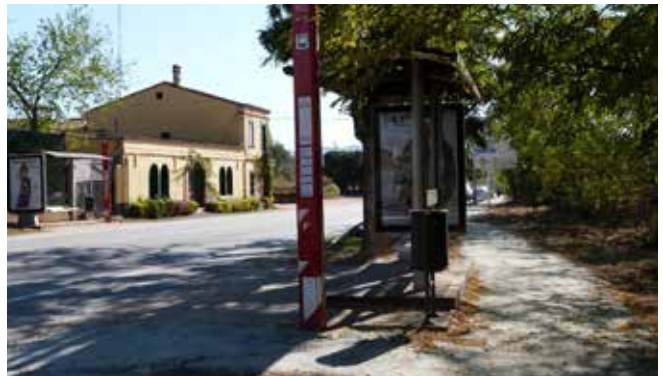
Parada d'autobús de la Masia Julià, amb el nou camí per a vianants a la dreta per accedir al polígon Riera de Caldes