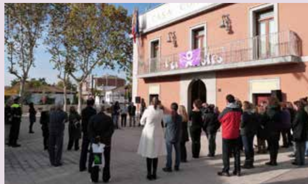
Lectura del manifest contra la violència vers les dones l'any 2012