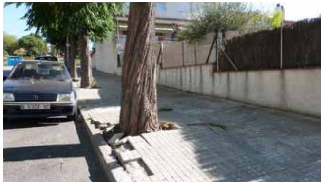
En els propers dies s'inicien els treballs per reparar voreres a diversos carrers de la Plana de Can Maiol