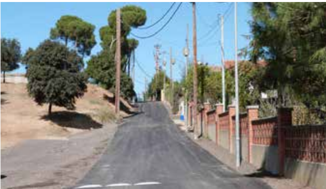
Carrer asfaltat al barri de Can Riera. Abans d'aquesta actuació era de terra