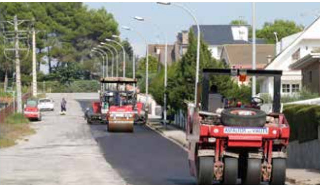
Màquines d'asfaltar al barri de Can Duran