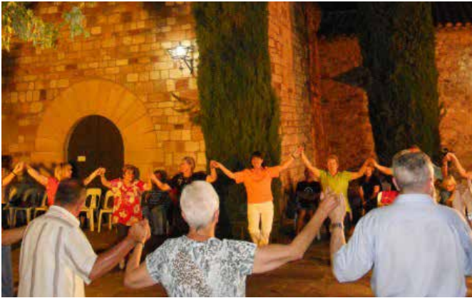
July 2012 · 25è aniversari de l'Associació Revetlla de Sant Pere