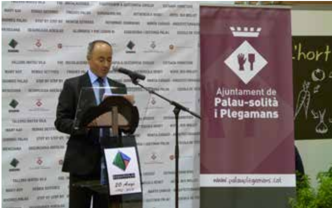
Setembre 2013 · 20è aniversari de l'Associació de Comerciants