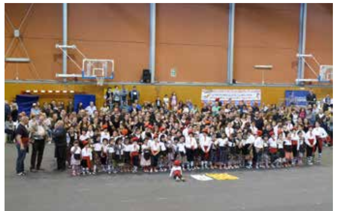
Maig 2013 · 30 aniversari de les colles del Ball de Gitanes