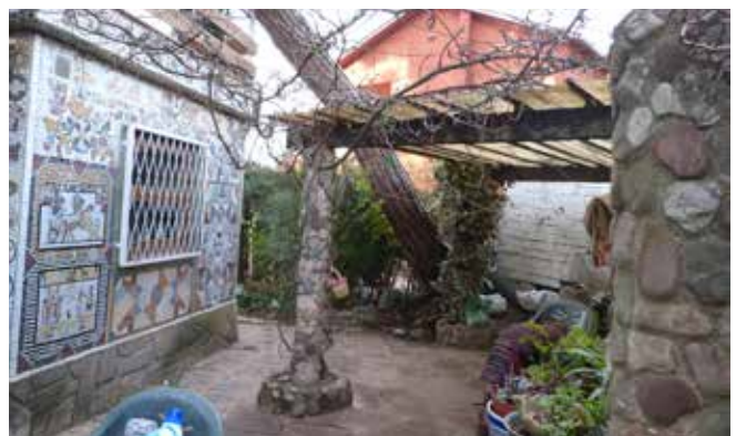
Molts arbres van caure als jardins particulars i van afectar els habitatges.