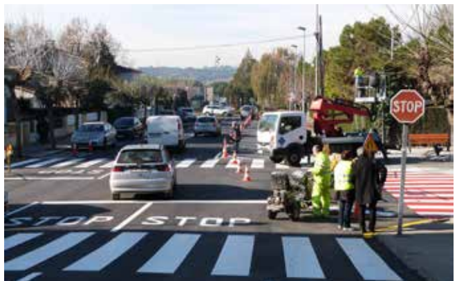
Millores a Can Cortès