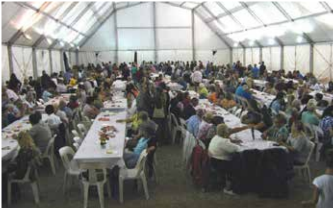
Setembre 2013 · 10è aniversari de l'Illa Comercial Palau