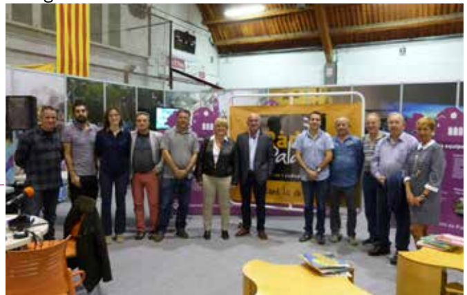
Octubre 2014 · 25è aniversari de Radio Palau