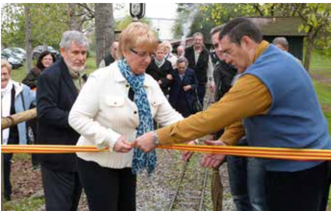
Novembre 2012 · 20è aniversari de l'Associació Cultural Amics del Ferrocarril