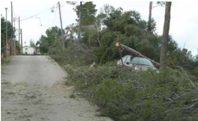
Vehicle atrapat a la zona dels Pins de Can Riera

Segons els càlculs, els danys de la ventada ascendeixen a un total de 91.871,81€. I l'Ajuntament ha demanat a la Generalitat i a la Diputació subvencions econòmiques, de gairebé 46.000€ a cadascuna, per poder fer front als danys.