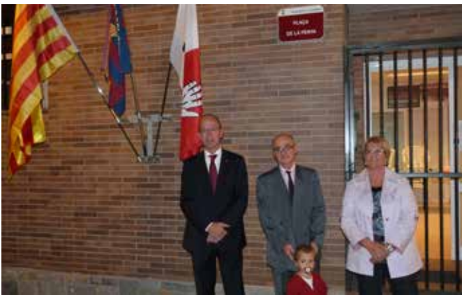
Setembre 2012 · 25è aniversari de la Peña Barcelonista