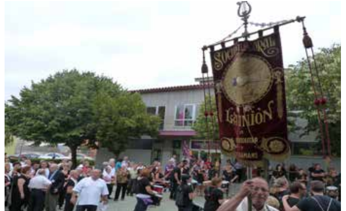
Setembre 2012 · 90è aniversari de la Societat Coral la Unió