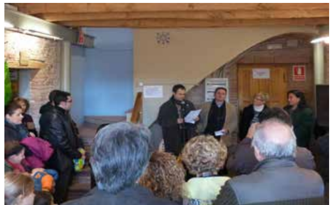
Desembre 2012 · 30a edició de l'Exposició de Pessebres de l'Ass. Pessebrista