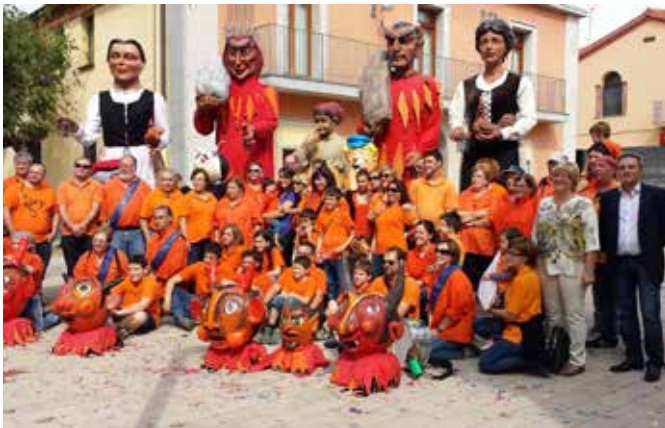
Octubre 2014 · 20è aniversari de l'Associació de Geganters i Gallers