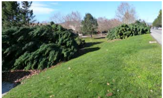
Al Pla de l'Alzina van caure moltes de les coníferes