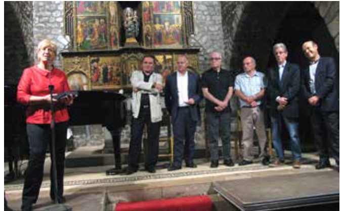
Setembre 2013 · 40a edició de les Nits Musicals, dels Amics de la Música Clàssica