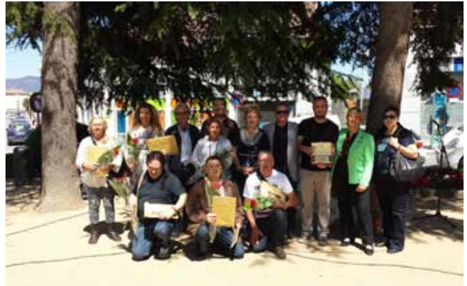
Maig 2014 · 25è aniversari del Grup de Teatre Farrigo Farrago