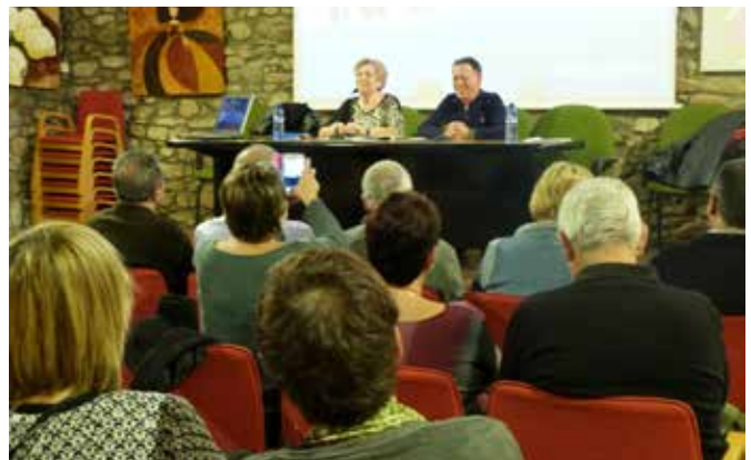
Desembre 2014 · 25è aniversari de la revista Palau Informatiu