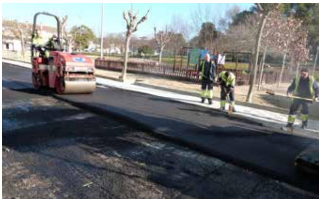
Asfaltat al Pla de l'Alzina