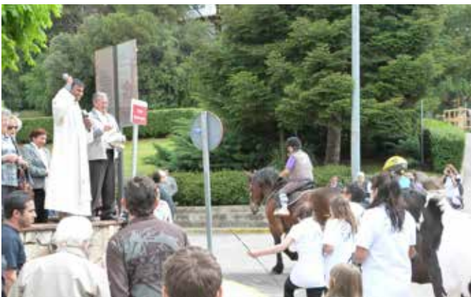
Maig 2013 · 30è aniversari del Patronat de Sant Isidre