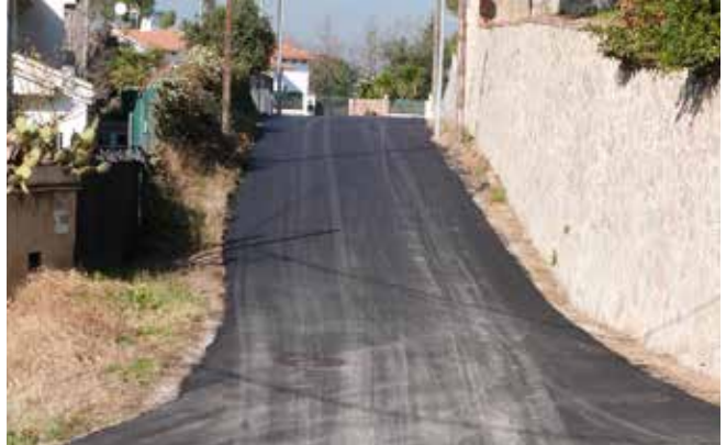
El barri dels Turons ja té els carrers asfaltats

de l'espai d'aparcament davant de la Masia. L'objectiu és potenciar al màxim l'accessibilitat a tot el municipi.