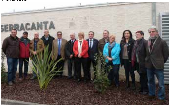
Novembre 2014 · Centenari del Futbol Club Palau