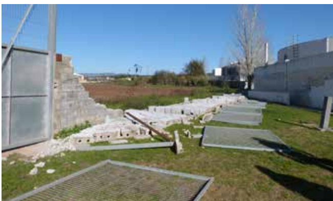
Van caure prop de 15 metres del mur de l'INS Ramon Casas i Carbó