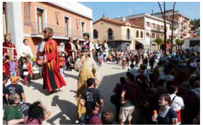
Octubre 2012 · 10è aniversari d'en Patufet