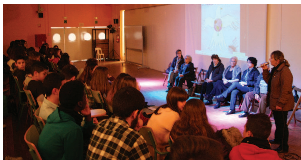
Xerrada amb entitats a la jornada

L'alumnat dels quatre cursos d'ESO de l'Institut Ramon Casas i Carbó, uns 600 nois i noies, han participat d'una jornada per la no-violència i la pau que va tenir lloc el 29 de gener. Sota el lema 'El mar no refusa cap riu', la jornada organitzada pel mateix professorat del centre va aplegar tallers, xerrades, la projecció de la pel·lícula 'Rebeldes del swing' i activitats artístiques, com música i poesia. Van comptar amb xerrades de Càritas Parroquial i el Banc d'Aliments, l'ONG Haribala, joves del Centre Educatiu l'Alzina, el Comitè de Solidaritat amb el Poble Sirià i la Lliga dels Drets dels Pobles. A més, els i les alumnes van conèixer la història de diverses personalitats que han treballat per la pau i van confeccionar el Mural per la Pau.