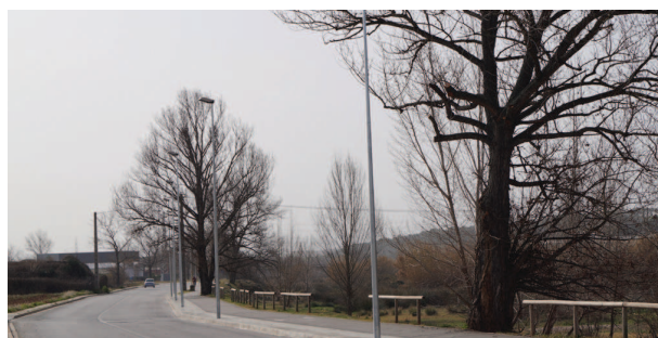
Instal·lació d'enllumenat a l'avinguda M. Aurèlia Capmany, entre carrer Can Llonch i carrer Migdia