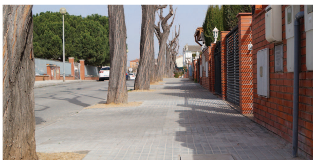
Arranjament de voreres i millora de l'accessibilitat al carrer de Sant Joan