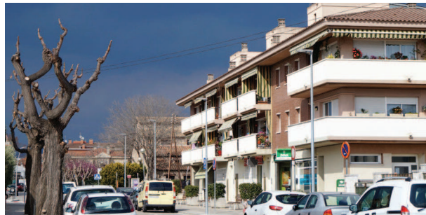
Nou enllumenat led al Camí Reial