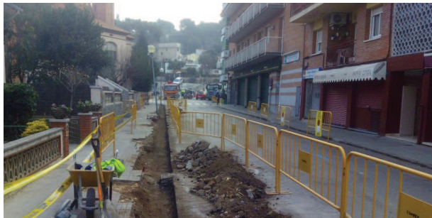
Arranjament de la vorera del carrer Barcelona