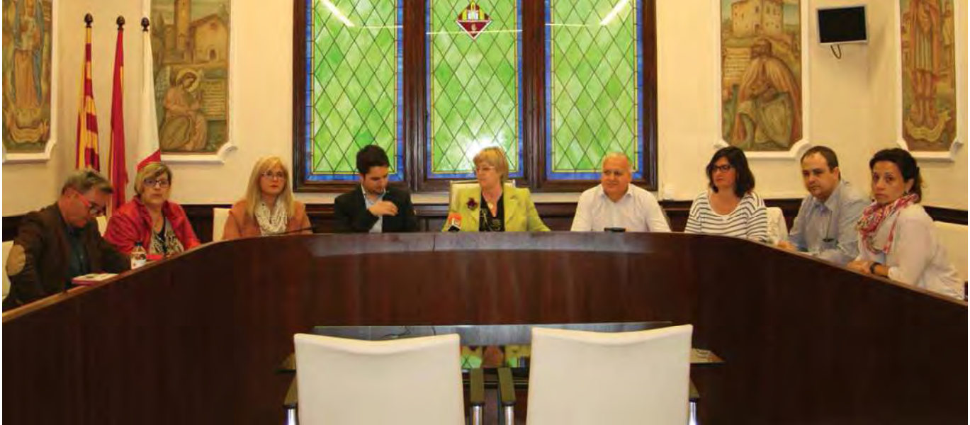
Els regidors del Govern Municipal van donar les dades del romanent positiu de l'Ajuntament

L'equip de govern de l'Ajuntament de Palau-solità i Plegamans exigeix que l'Estat derogui o reformi lleis aprovades en els darrers anys que restringeixen la capacitat de decidir a què es destinen els recursos propis. Es tracta de la Llei d'Estabilitat Pressupostària i Financera -també coneguda com a 'Llei Montoro'- i de la Llei de Racionalització i Sostenibilitat de les Administracions Locals (LRSAL), a més