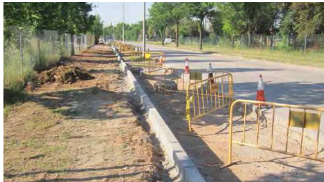
Reparació i millora de la vorera a l'av. Camí Reial amb Rda Boada Vell