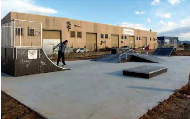
Aspecte actual de la pista d'Skate de Palau-solità i Plegamans