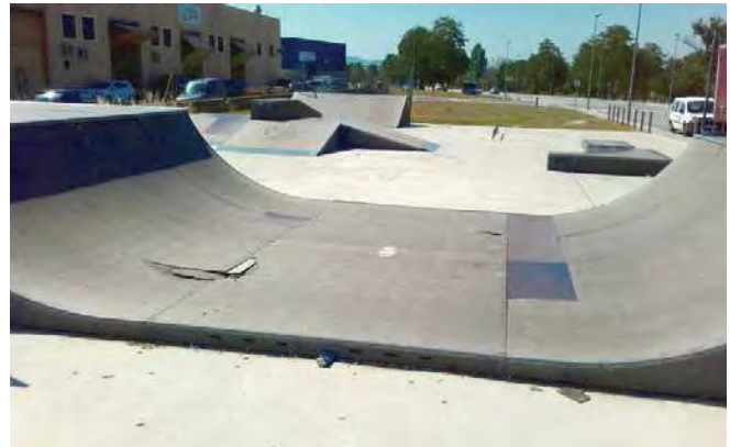
La pista no es troba en les millors condicions

L'Ajuntament ha engegat un procés participatiu sobre el nou Skate Park de Palau-solità i Plegamans, on els joves podran decidir com el volen. Aquest procés és vinculant i contempla diferents fases.