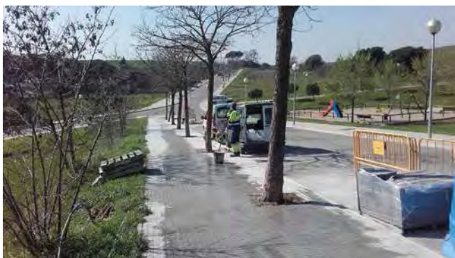
Reparació de la vorera del carrer Illes Balears

La regidoria de Via Pública continua amb el procés de reparació i millora dels espais públics com carrers, voreres i camins. Aquests mesos els treballs s'han centrat en la reparació de la vorera del carrer Illes Balears i de la reparació i millora de la vorera de l'avinguda del Camí Reial,