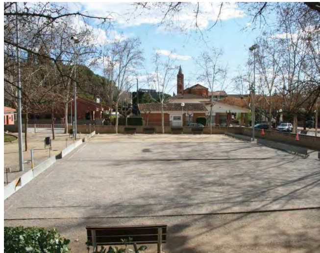
Espai on s'ubicarà la nova biblioteca municipal

L'equip redactor, a més, podrà ser contractat per l'Ajuntament per redactar el projecte bàsic i executiu.