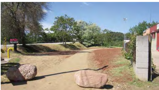
Millora de la zona verda al Camí Reial amb la C-155