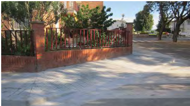
Accessibilitat a les voreres de l'avinguda Vergé de Montserrat