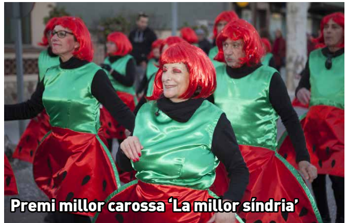
Premi millor carossa 'La millor síndria'