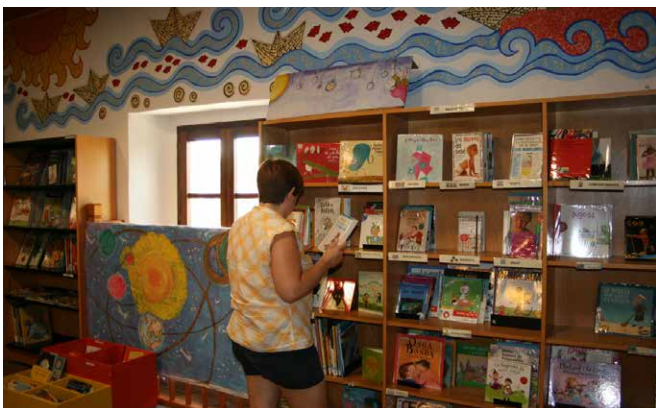
Treballadora d'un pla d'ocupació anterior.

Els contractes tindran una durada de 6 mesos a jornada completa i contemplen perfils professionals diversos, des d'educador/a d'escola bressol a tècnic/a de medi ambient, passant per la dinamització de la biblioteca. Les persones contractades s'incorporen a l'Ajuntament entre els mesos de febrer i juliol. L'objectiu del pla va més enllà d'oferir treball, sinó que també vol empoderar les persones i que tinguin més eines per tenir èxit al mercat laboral.