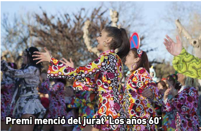
Premi menció del jurat 'Los años 60'